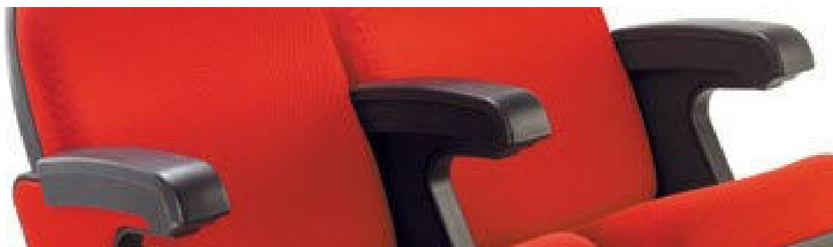
Brazo Normal de PVC

Conforme a las normativas internacionales UNE De seguridad preventiva contra incendios.